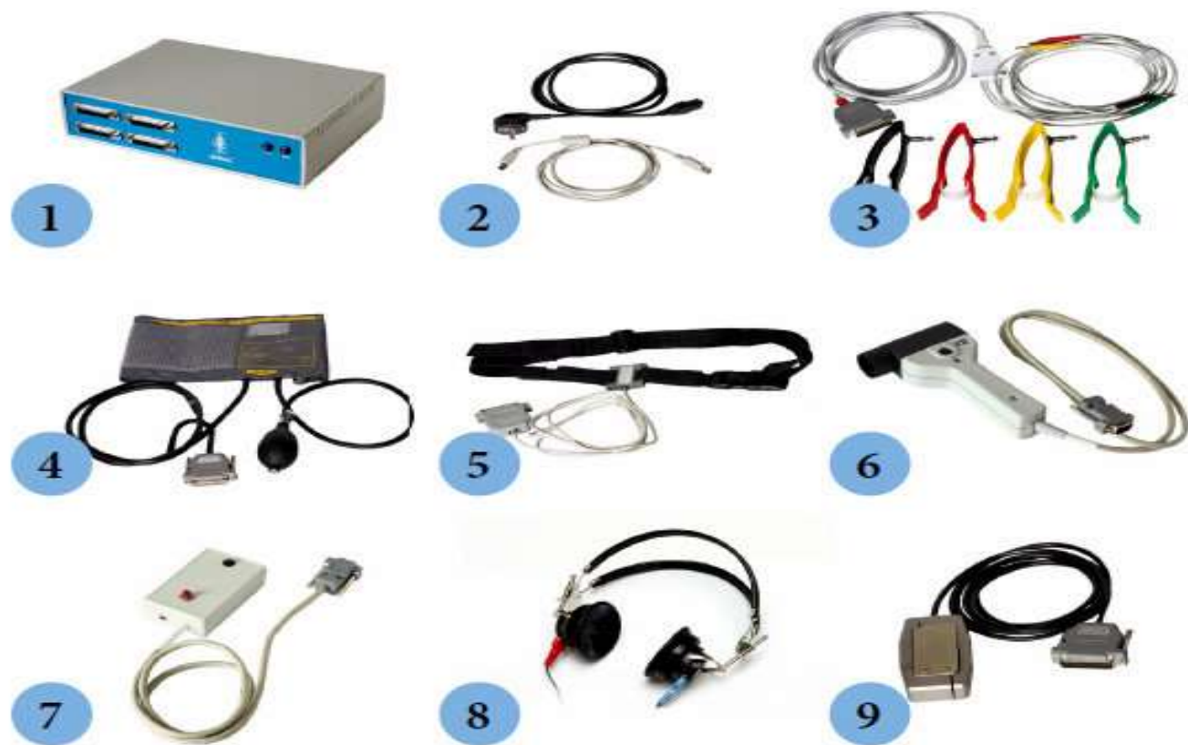
Рис.1. Состав базового комплекта Apparata «АРМИС»